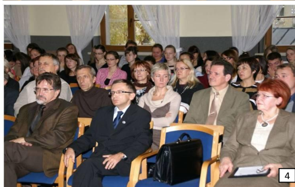
Spotkanie w PWSZ w Kaliszu