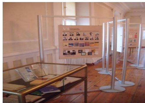
Wystawa w kościańskim ratuszu, gdzie znajduje się Muzeum Regionalne.