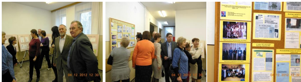
Wystawa w pilskim Oddziale US w Poznaniu.

W okresie od 24.11.2012 r. do 18.01.2013 r. wystawa była prezentowana także w pilskim Oddziale Urzędu Statystycznego w Poznaniu. Ekspozycja w tym miejscu umożliwiała zapoznanie się z jej treścią zarówno odwiedzającym Oddział US, jak i Starostwo Powiatowe w Pile. Przyciągała ona uwagę informacjami dotyczącymi całej Wielkopolski, ale miała też bardzo interesujące akcenty lokalne, które z archiwów wydobyli pilscy organizatorzy wystawy.