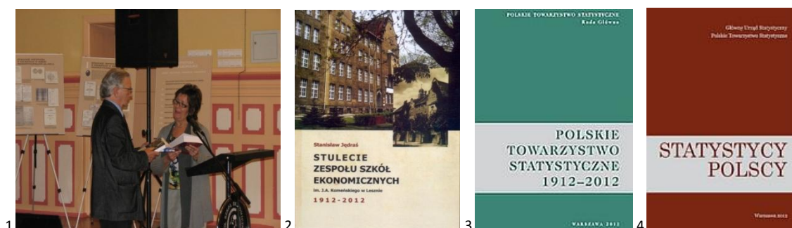
Wystawa i wykład w ZSE w Lesznie.