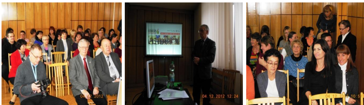
Wykład w pilskim Oddziale US w Poznaniu.