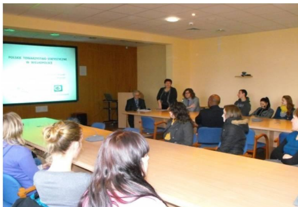
Otwarcie wystawy w PWSZ w Pile.