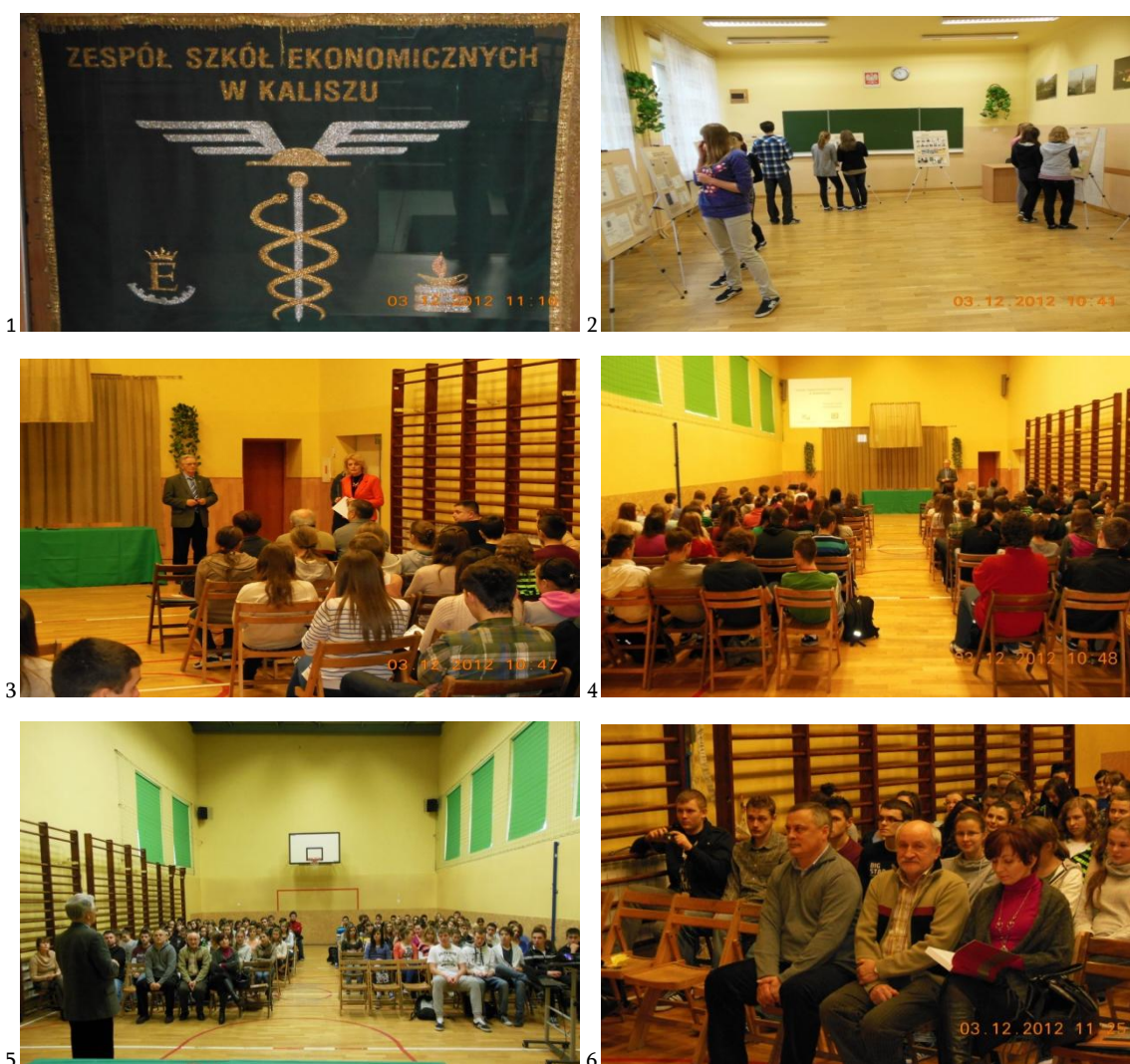
Wystawa i wykład w ZSE Kalisz.