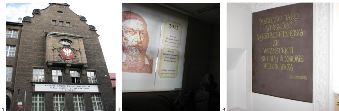
1) Zabytkowy budynek ZSE w Lesznie. 2, 3) Tablice pamiątkowe w budynku leszczyńskiego ZSE.

Na początek wystawa zawitała do Zespołu Szkół Ekonomicznych im. Jana Amosa Komieńskiego w Lesznie. Placówka ta, podobnie jak Polskie Towarzystwo Statystyczne, w 2012 r. obchodziła 100. rocznicę powstania.